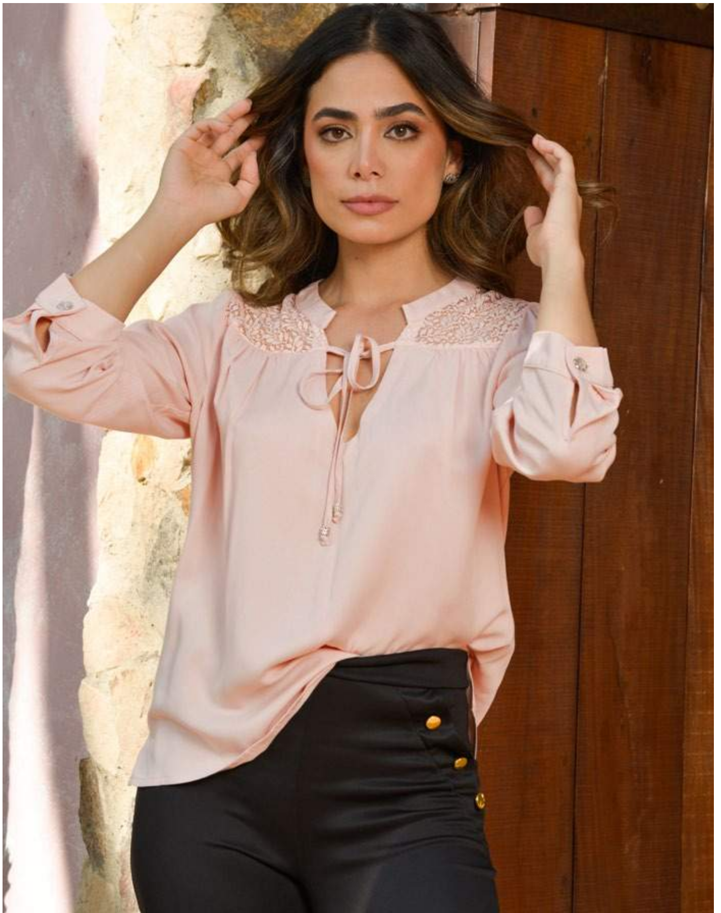
REF. 600268 CAMISERA EN RAYON CON BLONDA COLOR: ROSA TALLAS: XS-S-M-L-XXL $ 109.900 REF. 620133 LEGGINS EN TEJIDO DE PUNTO COlor: NEGRO Tallas: XS-S-M-L-XL $ 89.900