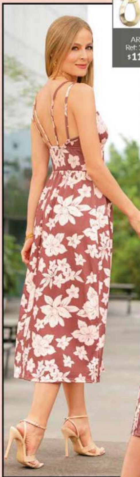
VESTIDO Ref: 166359 Midi de tiras graduables en las copas, en poliéster spándex. Color: Estampado (18). Tallas: 8-10-12 $ 84.999