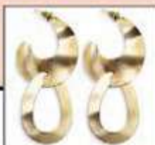
ARETES Ref: 116078 $11.999