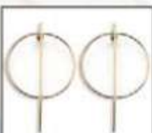
ARETES Ref: 116076 $11.999