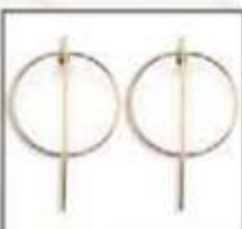
ARETES Ref: 116076 $11.999