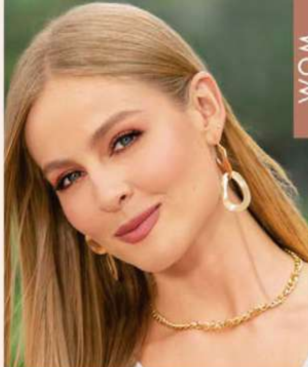
ARETES Ref: 116078 Color: Único (19). $ 11.999